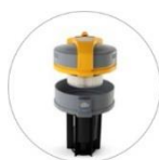
UFS podwójny system filtracji