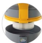
PTFE filtr kartridżowy (klasa filtrowania M)