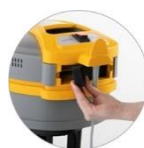
Filtr wylotu powietrza