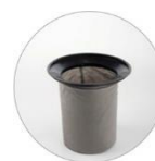
Filtr TNT (opcjonalnie)