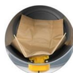
Worek papierowy (opcjonalnie)