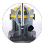
Uchwyt na akcesoria