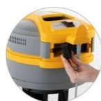
Wejście dla chłodnicy silnika